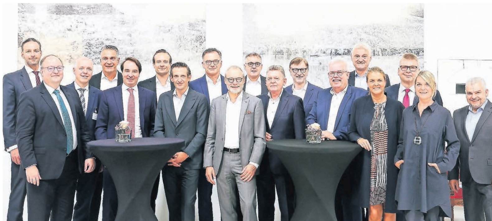
Unabhängige Vermögensverwalter und weitere Anlagespezialisten haben sich in der Fortschrittswerkstatt des RP-Forums getroffen, um sich über die Themen auszutauschen, die den Anlegern derzeit unter den Nägeln brennen.