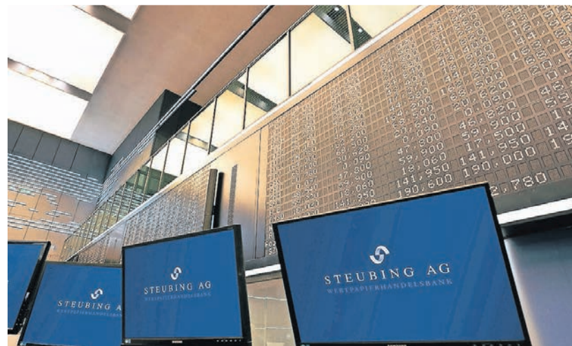
Die Steubing AG ist weltweit 63 internationalen Börsen- und Handelsplätzen vertreten.

Damit aus Plänen erreichbare Ziele werden